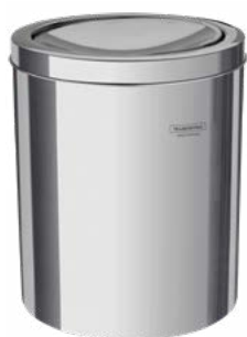
94542/105 5 L