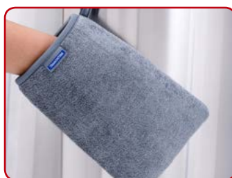
Material de fácil limpeza