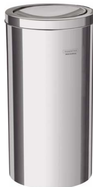
94542/130 30 L