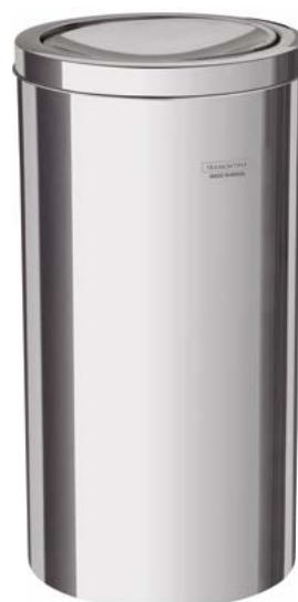
94542/120 20 L