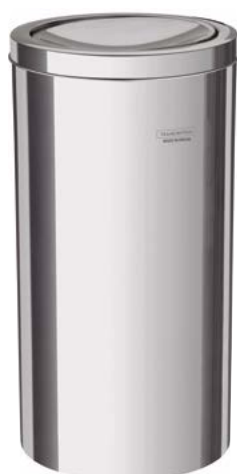
94542/112 12 L